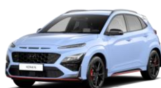
Performance Blue (SFB) Erivärv

Hyundai jätab endale õiguse muuta tehnilisi näitajaid ja hindu ilma eelneva etteatamiseta. Kõik siin nähtavad pildid on üksnes illustratiivsed. Tarnitavate autode tegelik varustus ja värvitoonid võivad näidatust erineda. Hyundai Motor Baltic Oy