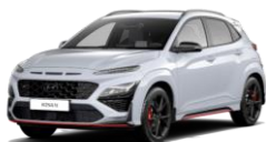
Sonic Blue (PYU) Erivärv