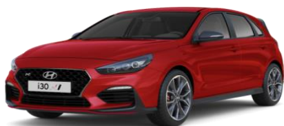
Engine Red (punane) (JHR) põhivärv