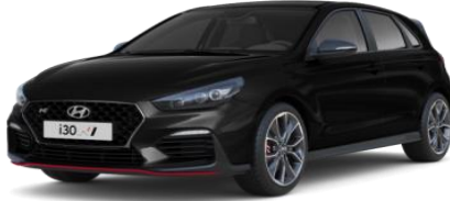
Phantom Black (must) (PAE) pärlmuttervärv