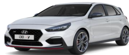
Polar White (PYW) (valge) põhivärv