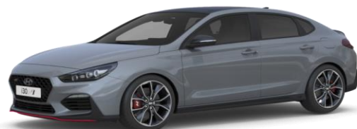
Shadow Grey (hall) (PYW) erivärv (saadaval ainult Fastback N mudelil)