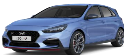
Performance Blue (sinine) (XFB) erivärv