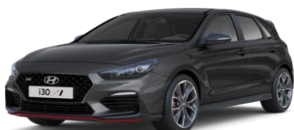
Micron Grey (hall) (Z3G) metallikvärv