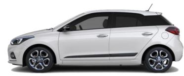
Sleek Silver (RYS) - металл