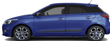
Champion Blue (U2U) - Металлик