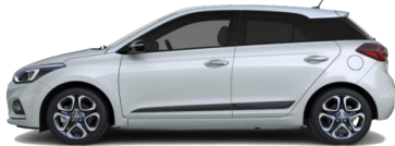
Clean Slate (UB2) - металл

Цвет «металлик» / перламутровый Крыша Phantom Black (черная) и черные глянцевые зеркала