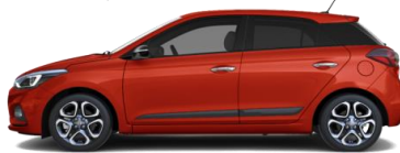
Tomato Red (TTR)