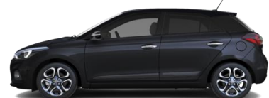
Phantom Black (X5B) - Перламутровый