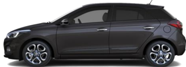
Stardust (V3G) - Металлик