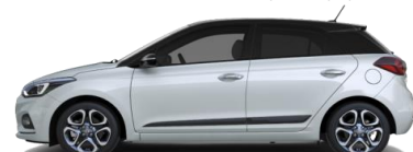
Clean Slate / Крыша Phantom Black