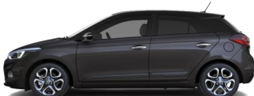
Stardust / Крыша Phantom Black