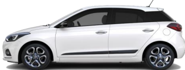
Polar White (PSW)