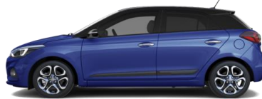
Champion Blue / Крыша Phantom Black